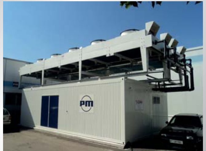
Beispiel für eine modulare Doppelcontainer-Energiezentrale bei einem Kunststoffverarbeiter aus dem Bereich Spritzguss/Systemtechnik.

Example for a modular double container power station at a plastics processor in the field of injection molding/system technology.