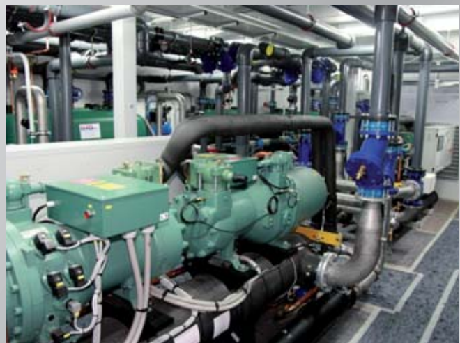
Blick in eine energieoptimierte Containerkühlanlage mit wassergekühlter Kältemaschine. View to an energy-optimized container cooling system with a water cooled chiller.

The plant equipment of an energy-efficient cooling water supply with chillers and pump-/tank units for two cooling circuits for different temperature levels as well as the associated switchgear cabinet will require some space. The space requirement will be higher if a compressed-air as well as heating power supply via costfree waste heat from the cooling circuit, a chiller winter relief and water treatment are additionally needed. In case of in-house systems the company must therefore provide suitable space which is sized correspondingly. However, this space is rare and valuable. Instead, it would be preferred to provide each square meter of free space for a production machine or the required peripherals. The contradiction that energy and fluid equipment is necessary but should not occupy any space at best can be solved ideally by the use of our modular energy centers. The entire equipment, normally housed in a room of a building, ties up space in a removable technical room which is installed in the outdoor area of the company. The components such as outdoor coolers, cooling towers or chillers will be installed in the environment.