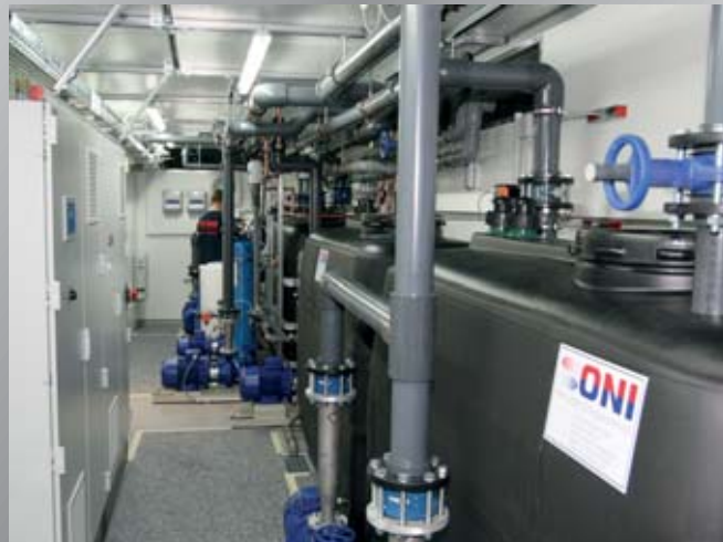
Endmontagephase einer modularen Energiezentrale zur Versorgung eines 2-Kreis-Kühlsystems bei einem Metallverarbeiter. Final assembly phase of a modular power station to supply a 2-circuit cooling system for a metal processor.

Für die Anlagentechnik einer energieeffizienten Kühlwasserversorgung mit Kälteerzeugern und Pumpen-/Tankeinheiten für zwei Kühlkreise mit unterschiedlichen Temperaturebenen sowie dazugehöriger Schaltschrankeinheit ist einiges an Platz notwendig. Entsprechend größer fällt der Platzbedarf aus, wenn zusätzlich eine Druckluft- sowie Heizwärmeversorgung über kostenlose Abwärme aus Kühlkreisen, eine Winterentlastung von Kältemaschinen und eine Wasseraufbereitung erforderlich ist. Bei Inhaus-Anlagen müssen im Unternehmen daher geeignete Räumlichkeiten zur Verfügung stehen, die ausreichend bemessen sind. Diese Flächen sind jedoch knapp und kostbar. Man möchte stattdessen lieber jeden freien Quadratmeter mit einer Produktionsmaschine oder der notwendigen Peripherie belegen. Der Widerspruch, dass die Energie- und Medientechnik zwar unbedingt benötigt wird, jedoch im besten Fall keinen Platz einnehmen soll, lässt sich durch den Einsatz unserer modularen Energiezentralen in idealer Form auflösen. Die gesamte Technik, die üblicherweise in einem Raum des Gebäudes untergebracht wird, findet in einem transportablen Technikraum Platz, der im Außenbereich des Unternehmens aufgestellt wird. Die Komponenten wie Freikühler, Kühltürme oder Kältemaschinen werden im Umfeld aufgestellt.