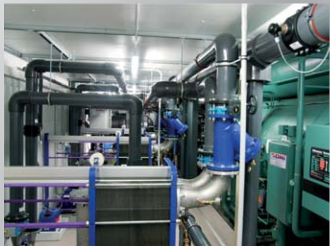
Blick in eine große, modulare Energiezentrale mit Absorptions-Kältemaschine und Wärmeaustauschereinheiten zur Systemtrennung. View into a large, modular power station with absorption refrigeration machine and heat exchanger units for system separation.

This is an additional reason for deciding on an ONI energy center which is equipped with state-of-the-art and energy-saving technology. To this effect, the solutions for reducing energy costs are manifold. For example, the power costs for operating chillers can be reduced up to 85 % by the use of a so-called winter relief. This technology simply uses the outdoor air as costfree cooling power during the transitional and winter months. Using an ONI heat recovery system reduces the heating costs for fuel oil or gas by up to 95 %. In this case dissipated heat available cost-free from the cooling circuits is converted to heating power which saves a lot of money. In addition, the use of especially power-efficient chillers, pumps, hydraulic systems and a proprietary software for system optimization reduce the power costs.