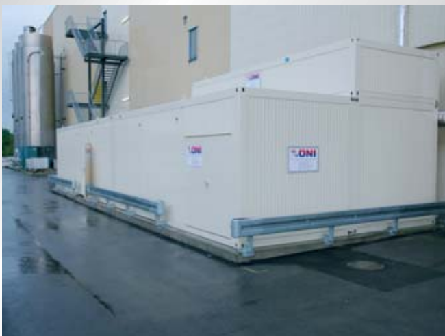
Blick auf eine aus 5 Modulen bestehende Container-Energiezentrale für mehrere Kühlkreisläufe bei einem Hersteller für Spezialpapiere. View of a container power station, consisting of 5 modules for several cooling circuits for a manufacturer of specialty papers.

Danach heißt es dann nur noch: Aufstellen, anschließen, fertig!