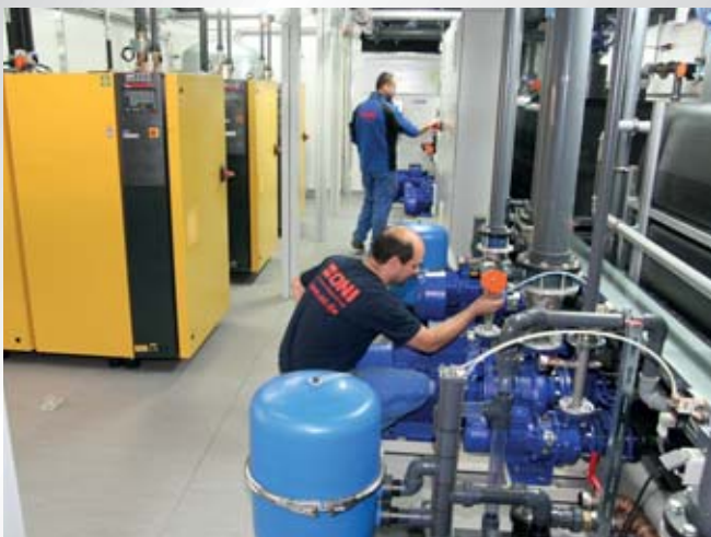
Container-Kühlanlage in Kombination mit einer zentralen Druckluft- Erzeugungsanlage mit Wärmerückgewinnung Container cooling system in combination with a central Compressed- air generating system with heat recovery

Wer freut sich nicht über die kontinuierlich positive Entwicklung eines Unternehmens. Zusätzliche Maschinen erfordern jedoch zusätzliche Stellfläche. In vielen Fällen resultiert daraus die Notwendigkeit eines Standortwechsels, mit dem erhebliche Kosten verbunden sind. In einem anderen Fall werden für eine Übergangszeit im Ausland Räume für eine Produktion angemietet, bevor in einen eigenen Produktionsstandort investiert wird. In solchen oder ähnlich gelagerten Fällen ist Flexibilität ein Faktor, der dem Anlagenbetreiber sehr viel Geld spart! Normalerweise ist der Anlagenbetreiber bei einem Ortswechsel gezwungen, erneut sehr viel Geld in die Erstellung von Energieversorgungsanlagen zu investieren. Darüber hinaus braucht es für die Erstellung der Anlagen Zeit. Durch den Einsatz modularer ONI-Energiezentralen reduziert sich auch in diesen Fällen das Kosten-/Zeitproblem auf ein Minimum. Mit den Produktionsmaschinen zieht auch die komplette Energieerzeugung um! Die Anlagenbausteine werden vom vorhandenen Netz abgetrennt, wenn notwendig in Teileinheiten zerlegt, und auf Tief ladern an den neuen Bestimmungsort gebracht. Dort angekommen, werden die Einheiten wieder zusammengestellt, in Betrieb genommen und die Fertigung läuft in kürzester Zeit wieder an.