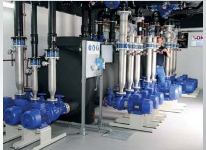
Blick in eine große Container-Kühlanlage, für einen Metall verarbeitenden Betrieb, die aus mehreren Modulen besteht. View into a large container cooling system for a metal-working operation, which consists of several modules.

Who is not pleased with the continually positive development of a company. However, additional machines require additional space. In many cases this results in the necessity for a change in sites, which is connected with considerable costs. In another scenario rooms for a production are rented abroad before investments are made into the own production site. In such or similar cases flexibility is a feature which saves a lot of money for the plant operator! In case of a change in locations the plant operator is normally compelled to re-invest a lot of funds in the creation of energy-supply systems. In addition, the creation of plants needs time. Even in these cases the use of modular ONI energy centers minimizes the cost and time problem. Together with the production machines the complete energy generation is relocated! The plant modules are disconnected from the existing network. If required, they are disassembled into different partial units and moved to the new destination on flat-bed trailers. Once they arrive there, the units will be re-assembled and commissioned. Production will then be started within the shortest time.