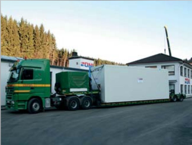
Das erste Modul einer großen Energiezentrale geht auf die Reise zu einem langjährigen, weltweit produzierenden Kunststoffverarbeiter. The first module of a large energy center is on its way to a long-standing plastics processing plant operating worldwide.

Immer mehr Unternehmen in der Welt entscheiden sich für den Einsatz einer modularen Energiezentrale aus dem Hause ONI. Neben der hohen Effizienz und Zuverlässigkeit werden von unseren Kunden die schnelle Verfügbarkeit der Energemedien, die Flexibilität und die platzsparende Ausführung geschätzt. Der modulare Aufbau bietet zudem den Vorteil einer individuellen Anpassung an die spezifischen Anforderungen hinsichtlich Leistung und Versorgungsspektrum. Für die verschiedenen Anwendungsgebiete stehen Modulbausteine - zur Versorgung mit Kühl- und Kaltwasser, Heizenergie aus Abwärme, Druckluft, Stoffen zur Wasserbehandlung oder aufbereitetem Wasser für die Netz-Nachspeisung - zur Verfügung. Der konstruktive Aufbau unserer Energiezentralen besticht durch eine klare Gliederung, Funktionalität und gute Zugänglichkeit aller Komponenten. Faktoren, die im Hinblick auf Wartungsarbeiten oder den Fall einer Anlagenerweiterung sehr wichtig sind. Für die Planung der Energiezentralen steht unserem Mitarbeiterstab in der Konstruktion daher auch modernste Technik zur Verfügung. So zum Beispiel extrem leistungsstarke Rechner mit CAD-Programmen zur dreidimensionalen Darstellung der Anlagentechnik an Doppelbildschirm-Arbeitsplätzen.