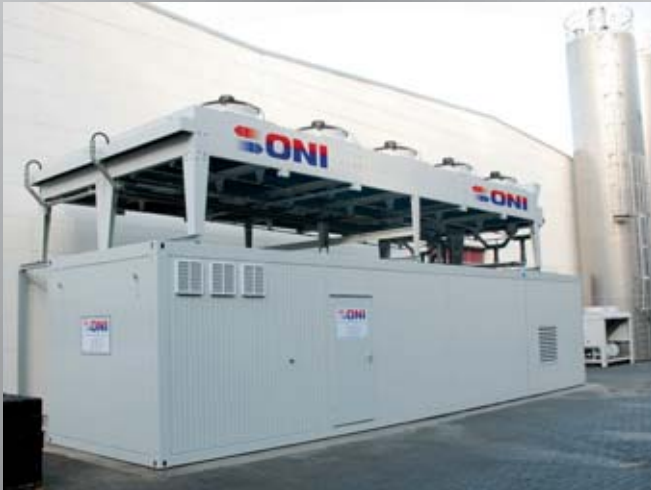
Zentralmodul einer Energiezentrale mit aufgesetzten, glykolfreien Freikühlern für ein Zweikreis-Kühlsystem mit Winterentlastung. Central module of an energy center with glycol-free outdoor coolers on the top for a double-circuit cooling system with winter relief.

Die sichere Versorgung mit Energie und den verschiedenen Medien hat in Produktionsbetrieben höchste Priorität! Die kontinuierlich steigenden Energiekosten gewinnen jedoch zunehmend an Bedeutung. Nur wer auch seine Energiekosten möglichst niedrig hält, schafft jetzt und in der Zukunft gute Wettbewerbsbedingungen für sein Unternehmen. Ein Grund mehr, sich für eine modulare Energiezentrale von ONI zu entscheiden, die mit modernster, energiesparender Technik ausgerüstet wird. Die technischen Lösungen zur Reduzierung von Energiekosten sind dabei vielfältig. So lassen sich beispielsweise durch den Einsatz einer so genannten Winterentlastung die Stromkosten für den Betrieb von Kältemaschinen um bis zu 85 % reduzieren. Bei dieser Technik nutzt man in den Übergangs- und Wintermonaten einfach die Außenluft als kostenlose Kühlenergie. Durch den Einsatz einer ONI-Wärmerückgewinnung lassen sich die Heizkosten für Heizöl oder Gas um bis zu 95 % senken. In diesem Fall wird kostenlos zur Verfügung stehende Abwärme aus Kühlkreisläufen zu Heizwärme, die viel Geld spart. Darüber hinaus lassen sich die Stromkosten durch den Einsatz besonders energieeffizienter Kältemaschinen, Pumpen, Hydrauliksysteme und einer von uns entwickelten Software zur Systemoptimierung reduzieren.